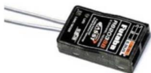
Рис. № 11 – Приемник аппаратуры управления.

Видеопередатчик (рис. № 10) – это устройство, передающее на наземную станцию изображение с камер БПЛА. Является самым заметным устройством на борту БПЛА, поэтому без необходимости включать его не стоит (это касается только тех БПЛА, которые хранят фотографии на борту), соблюдая режим радиомолчания. Такой режим уменьшает возможность применения противником средств РЭБ.