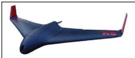
Рис. № 7 – БПЛА тип «летающее крыло».