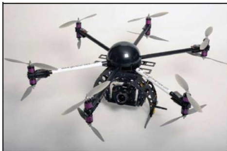
Рис. № 5 – многомоторный БПЛА.

распространение, – многороторные системы. Их еще называют мультикоптерами, квадрокоптерами, гексакоптерами, октакоптерами и тому подобное, в зависимости от количества несущих винтов. Характерная особенность – многомоторная система, принцип полета – подобен вертолетному (рис. № 5).