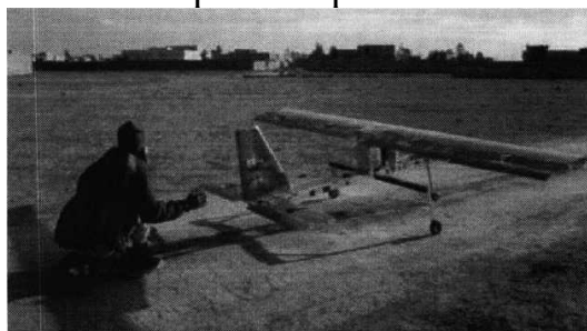
Рис. № 4 – малогабаритный летательный аппарат.

БВС-камикадзе является весьма специфичным классом беспилотной техники, информация о котором чаще всего носит секретный характер. Такой дрон представляет собой малогабаритный летательный аппарат (рис. № 4), способный нести несколько килограмм взрывчатки.