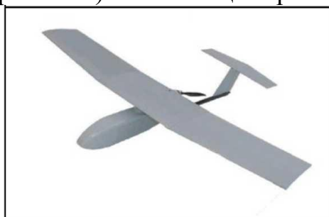
Рис. № 6 – БПЛА самолетного типа.

Существуют БПЛА, предназначенные для выполнения задач РЭР, РЭБ и связи. Скоростной диапазон работы – от 15 до 30 м/с. Рабочие высоты – в зависимости от оборудования и размеров аппарата, но всегда превышают 300 м. Обычно это диапазон высот 300 – 2000 м. Существует несколько аэродинамических схем самолетных БПЛА. Основные аэродинамические схемы – классическая (рис. № 6) и «летающее крыло» (рис. № 7).