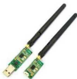
Рис. № 9 – Модем телеметрии.

Модем телеметрии (рис. № 9) – приемное устройство, предназначенное для обмена информацией между наземной станцией и БПЛА. От наземной станции он посылает команды к выполнению, от БПЛА – принимает на наземную станцию информацию, получаемую с датчиков (например, скорость, потребление тока, напряжение, положение в пространстве. Обычно является основным каналом управления БПЛА.