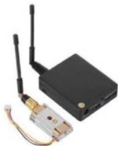
Рис. № 10 – Видеопередатчик.

Видеопередатчик (рис. № 10) – это устройство, передающее на наземную станцию изображение с камер БПЛА. Является самым заметным устройством на борту БПЛА, поэтому без необходимости включать его не стоит (это касается только тех БПЛА, которые хранят фотографии на борту), соблюдая режим радиомолчания. Такой режим уменьшает возможность применения противником средств РЭБ.