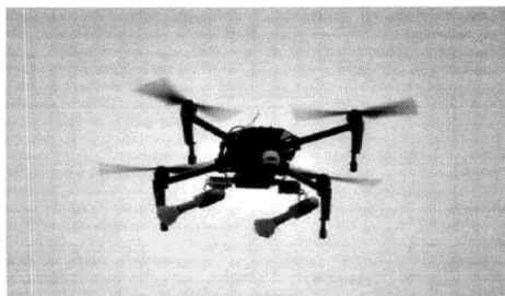
Рис. № 3 – квадрокоптер.

Этот беспилотник может нести до двух взрывных устройств, снабженных стабилизаторами и простейшим контактным взрывателем ударного действия. В качестве системы крепления для гранат боевики используют отрезок пластиковой трубы, в которой с помощью лески закрепляется граната.