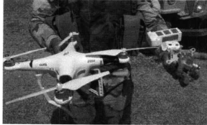
Рис. № 1 – БВС вертолетного типа.

Для совершения диверсионных актов могут использоваться БВС самолетного и вертолетного типа (рис. № 1) кустарного производства, причем доля последних значительно превышает количество самолётных. Объясняется это в первую очередь их более низкой стоимостью.