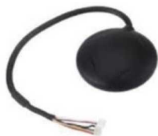
Рис. № 8 – Модуль GPS-навигации.

По сути, модуль GPS навигации (рис. № 8) является приемником GPS-сигнала с калькулятором, устанавливается подальше от оборудования, создающего электромагнитные наводки. Модуль необходим для ориентирования в пространстве, для определения расположения БПЛА. В мире существует несколько систем спутниковой навигации, а именно: американская – GPS, европейская – Galileo, российская – ГЛОНАСС, китайская – Бейдоу. Разницы для пользователя практически никакой.